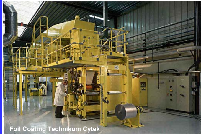
Foil Coating Technikum Cytek